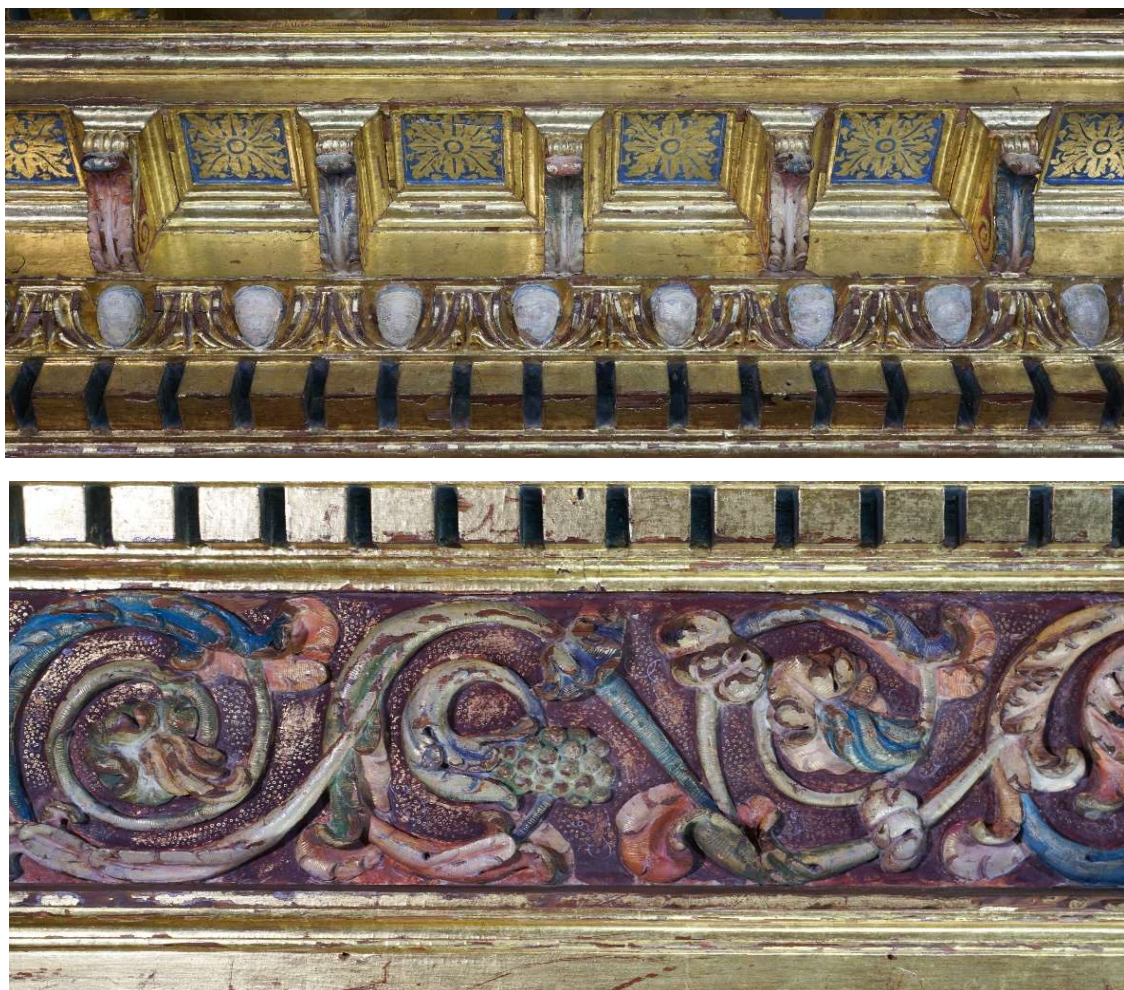
Detalles de la decoración del friso del retablo tras su restauración

Estos dos retablos hoy están ciertamente modificados en su contenido, ya que el Cristo crucificado hoy no se conserva y en su lugar se colocó la imagen de la Virgen de la Merced y sus santos, una vez llegada la congregación a esta Santa Casa a partir de 1926. Para el otro colateral, el del Evangelio, hoy han desaparecido tanto el niño Jesús, del que solo se conservan los vestidos que pueden verse expuestos en la Sacristía del Santuario, y los bustos relicarios desaparecieron durante la reforma del Santuario emprendida entre 1983-1993. Aún así, la estructura de los retablos se mantiene prácticamente intacta salvo la existencia de los frontones superiores de cada uno de ellos.