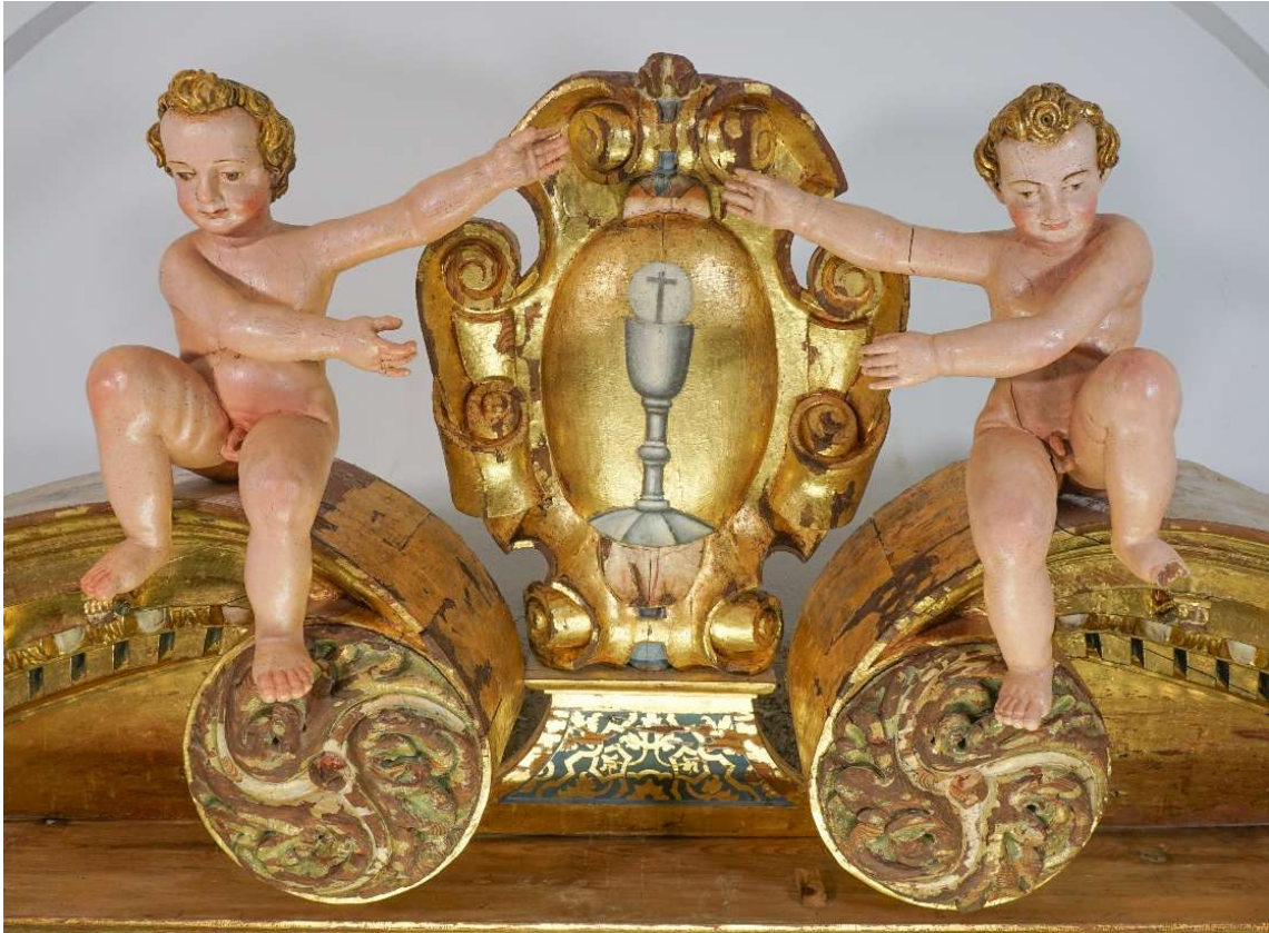
Detalle de la decoración del frontón superior del retablo configurada a través de un frontón partido con volutas y motivos vegetales, así como dos ángeles que sostienen la imagen del cáliz con la sagrada forma.