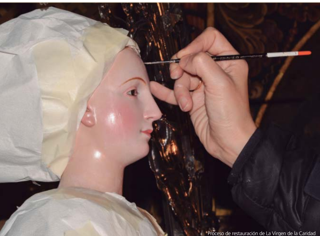
Proceso de restauración de La Virgen de la Caridad