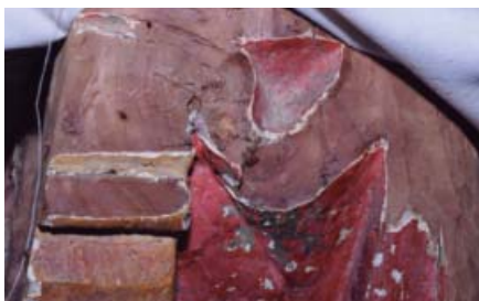
Detalle del trono de La Virgen de La Caridad antigua

Ya hemos hablado del canon románico que tenía la primitiva imagen de Ntra. Sra. de la Caridad de Illescas, realizada dicha talla en los primeros años del XIII, pero la primera referencia de su existencia es de esa misma época: en 1275 la Virgen de la Caridad de Illescas marcha a Madrid para procesionar junto con la Virgen de Atocha para pedir lluvias tras una prolongada sequía.