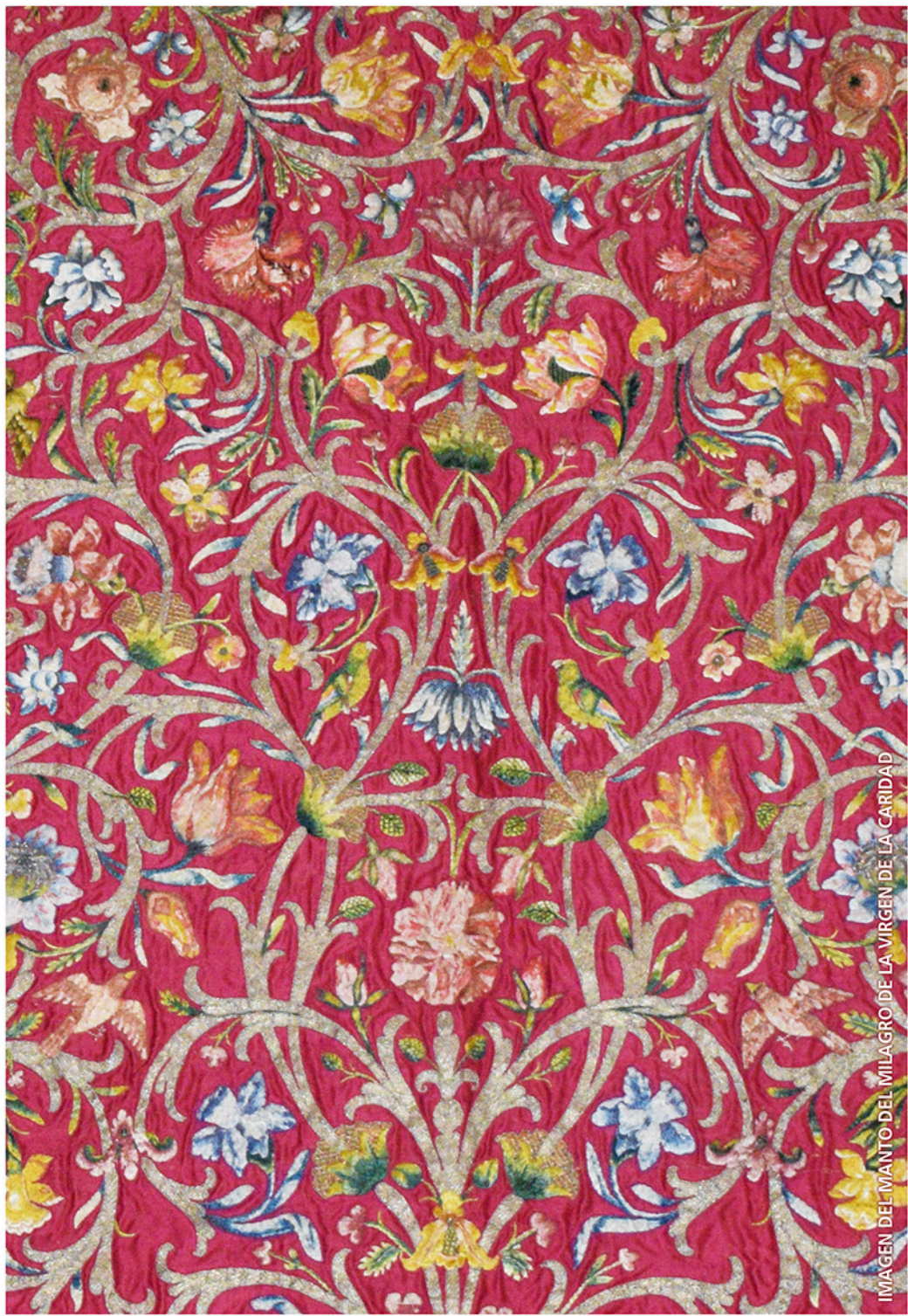
IMAGEN DEL MANTO DEL MILAGRO DE LA VIRGEN DE LA CARIDAD