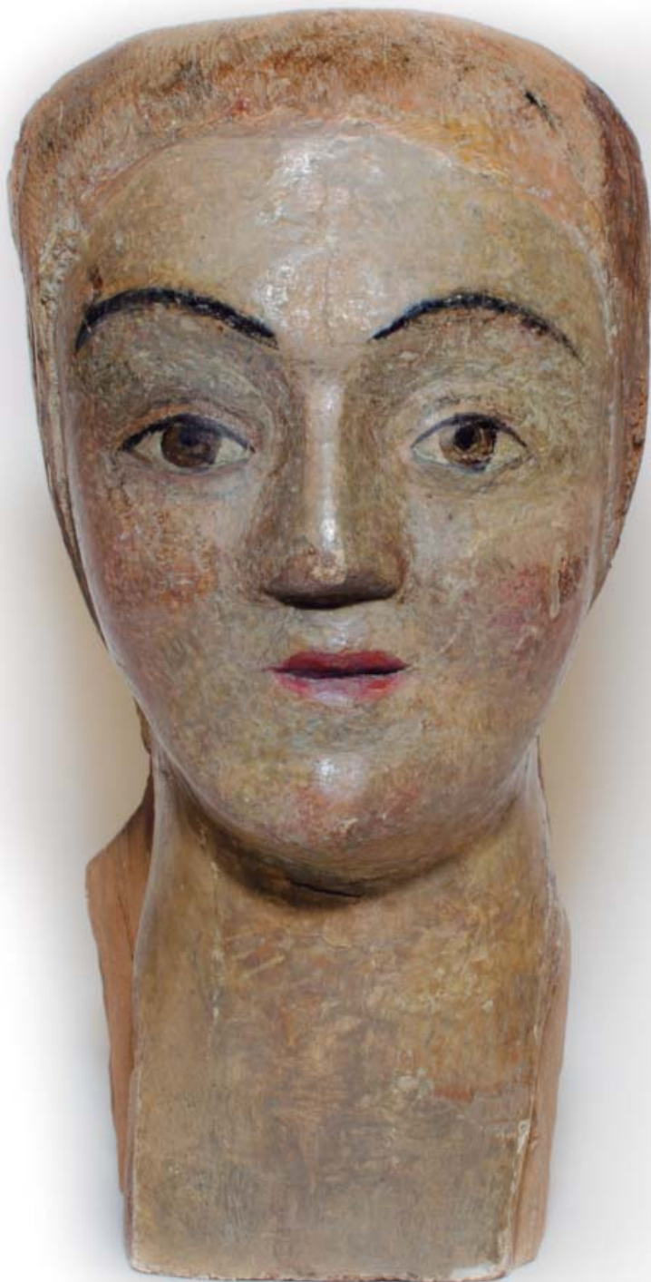
Rostro de La Virgen de la Caridad antigua