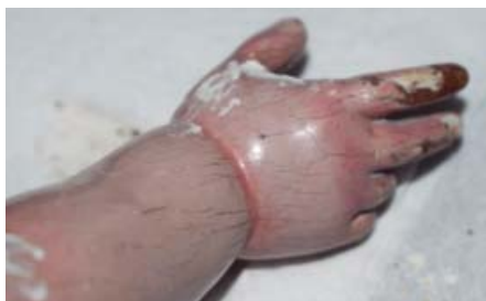
Estado previo a la restauración de la mano del Niño Jesús